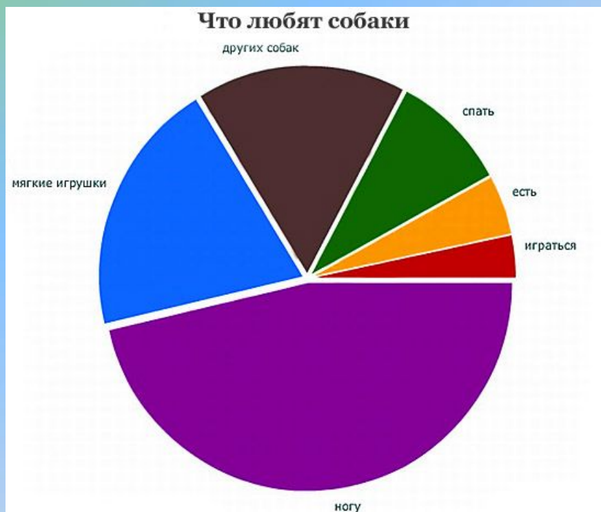
Диаграмма 1. Любимые занятия собак