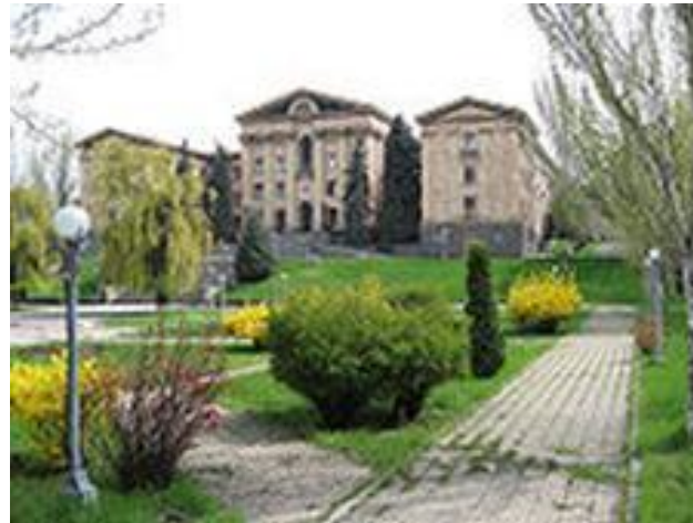
Здание Национальног о собрания