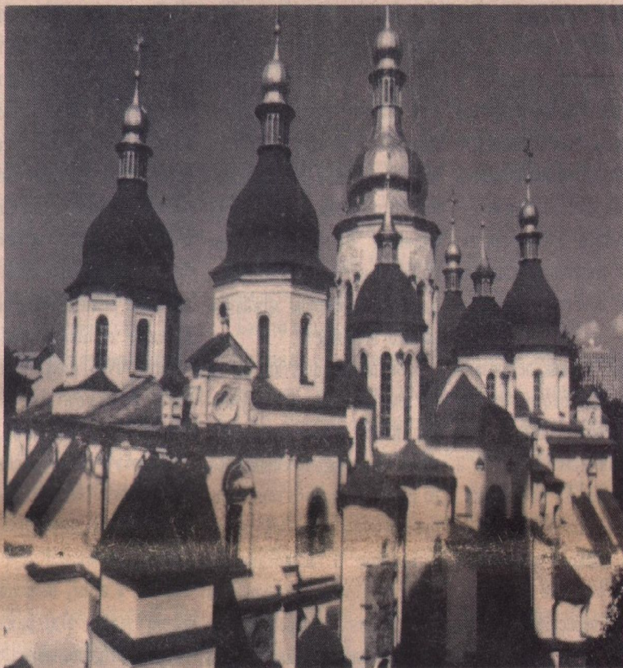
СОБОР СВ. СОФІЇ В КИЄВІ

То не сон... Не сон... То ява! То воскресла наша слава! День відродження Держави! То не мрія і не казка, І не вороженьків ласка, Це грімке, могутнє: "Хочу!" Голос генія Народу, Що веде... що рве в свободу, Мов Богднова булава! — Хочу! Землю знов єдночу! Відбудую і руїну І трівку дам підвалину! На цеглинах до будови Герб кладу Володимира! В мене міць, в живучість віра, Прометей жар любови, Геній я і Дух народу!