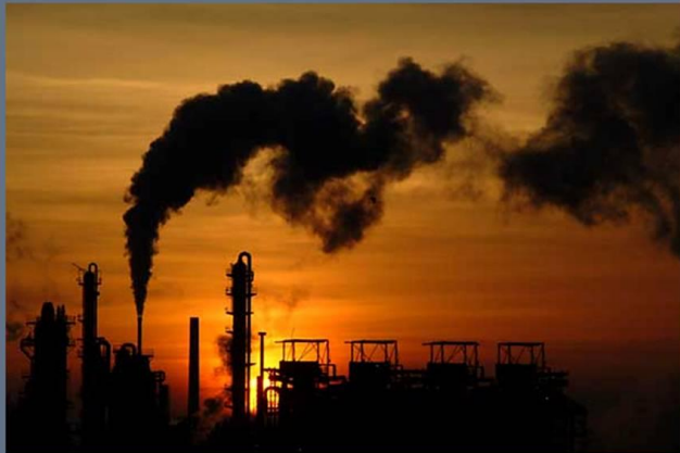
Особенно сильно от загрязнения атмосферы страдают крупные промышленные города.