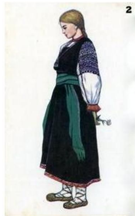
Женский костюм Воронежской губернии