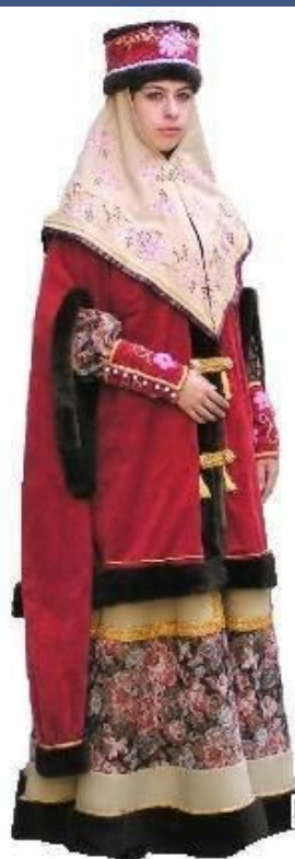
Н. ЛЯДОВА КОСТЮМ БОЯР КОНЕЦ 17В.

Верхняя женская одежда была опашень, длинная одежда с частыми пуговицами от верху до низу; у богатых они были золотые или серебряные вызолоченные, у бедных – оловянные. Эта одежда делалась из сукна, обыкновенно красных цветов; рукава были до пят, но пониже плеча делались разрезы или проймы, сквозь которые свободно входила рука, а остальная часть рукава висела. Вокруг шеи пристёгивался широкий меховой, обычно бобровый воротник.