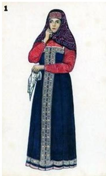
Женский костюм Ярославской губернии

Женский наряд отличался от мужского шириной и длинными рукавами, цвета белого или красного. Рукава женских рубашек были довольно узкие, но от трёх-четырёх аршин длины, поэтому их собирали в складки, которые покрывали сгибы пальцев. Поверх рубашки надевали летник: одежда эта не была длинная и не доходила до пят. К летникам пристёгивалось шейное ожерелье.