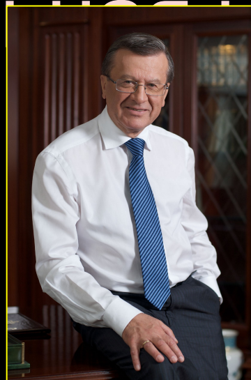
Виктор Алексеевич Зубков

«Единогласное голосование стран-членов Форума за нашего кандидата обосновывалось только исключительным признанием роли России именно на страте этой организации, потому что Россия сегодня может достаточно независимо проводить диалог со странами-производителями и странами-потребителями газа». (Тогдашний министр энергетики С. Шматко)