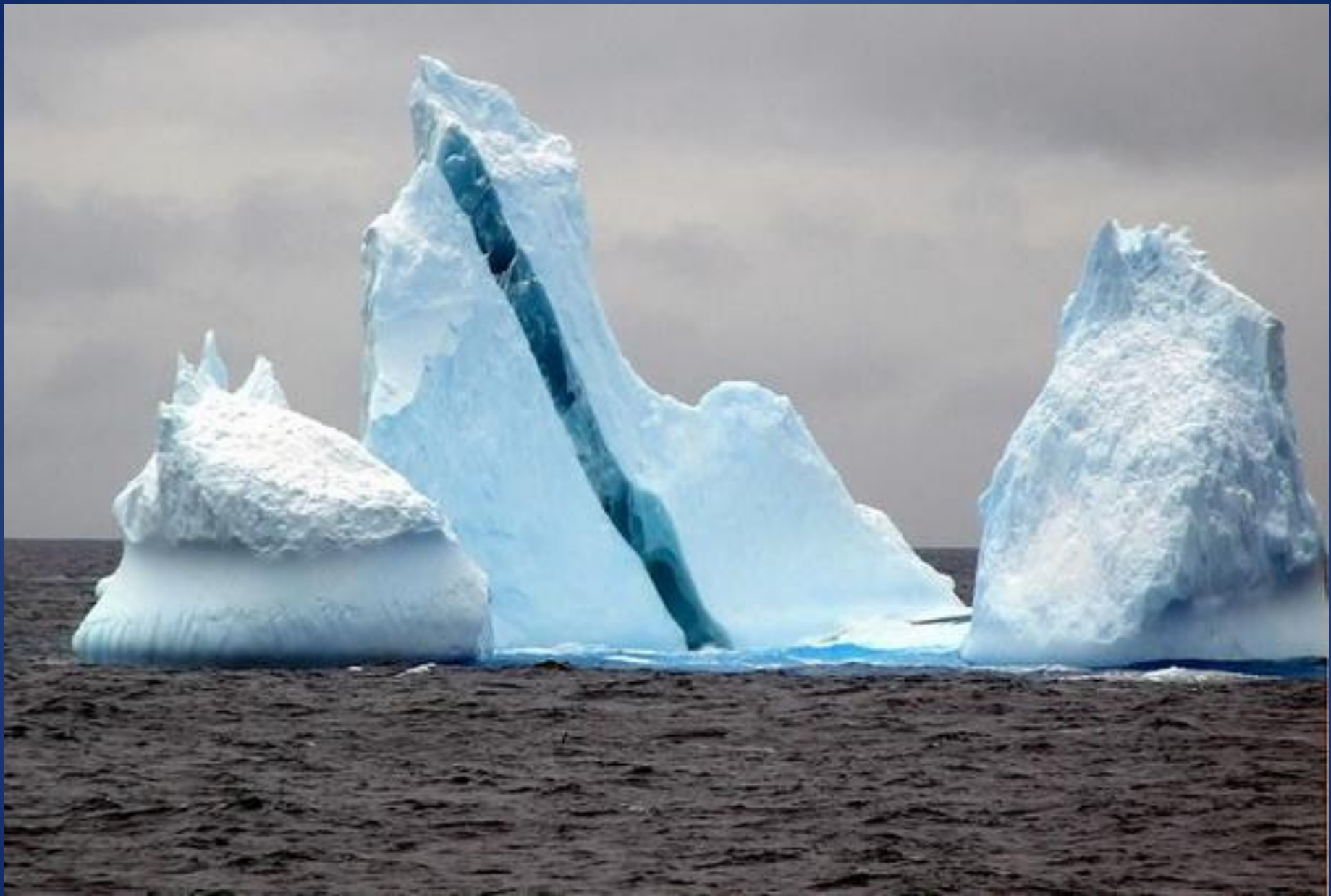
Айсберг с прослойкой из голубого льда.