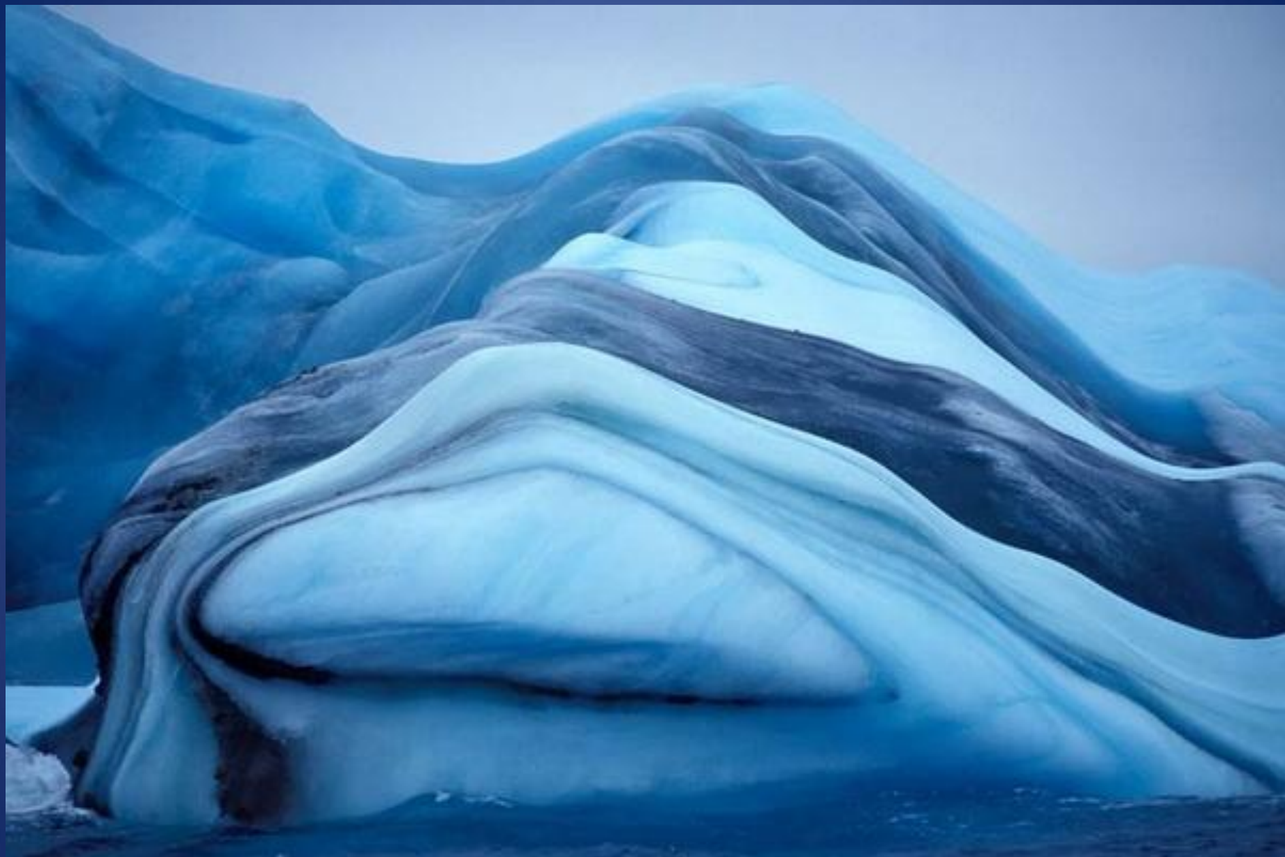
Айсберг с голубыми ледяными прослойками.