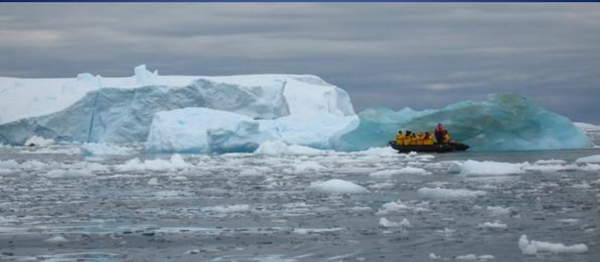
Прозрачный айсберг, расположенный в заливе Бискошиа.