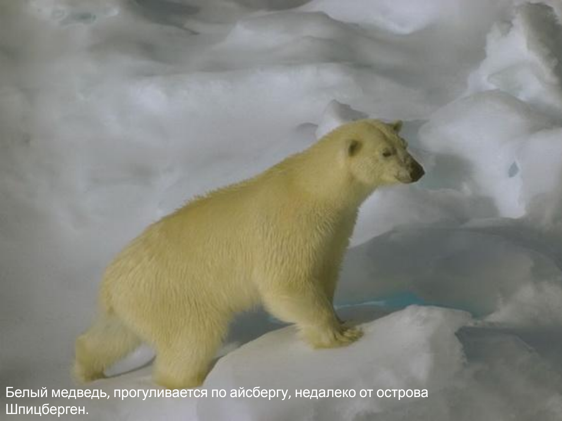
Белый медведь, прогуливается по айсбергу, недалеко от острова Шпицберген.