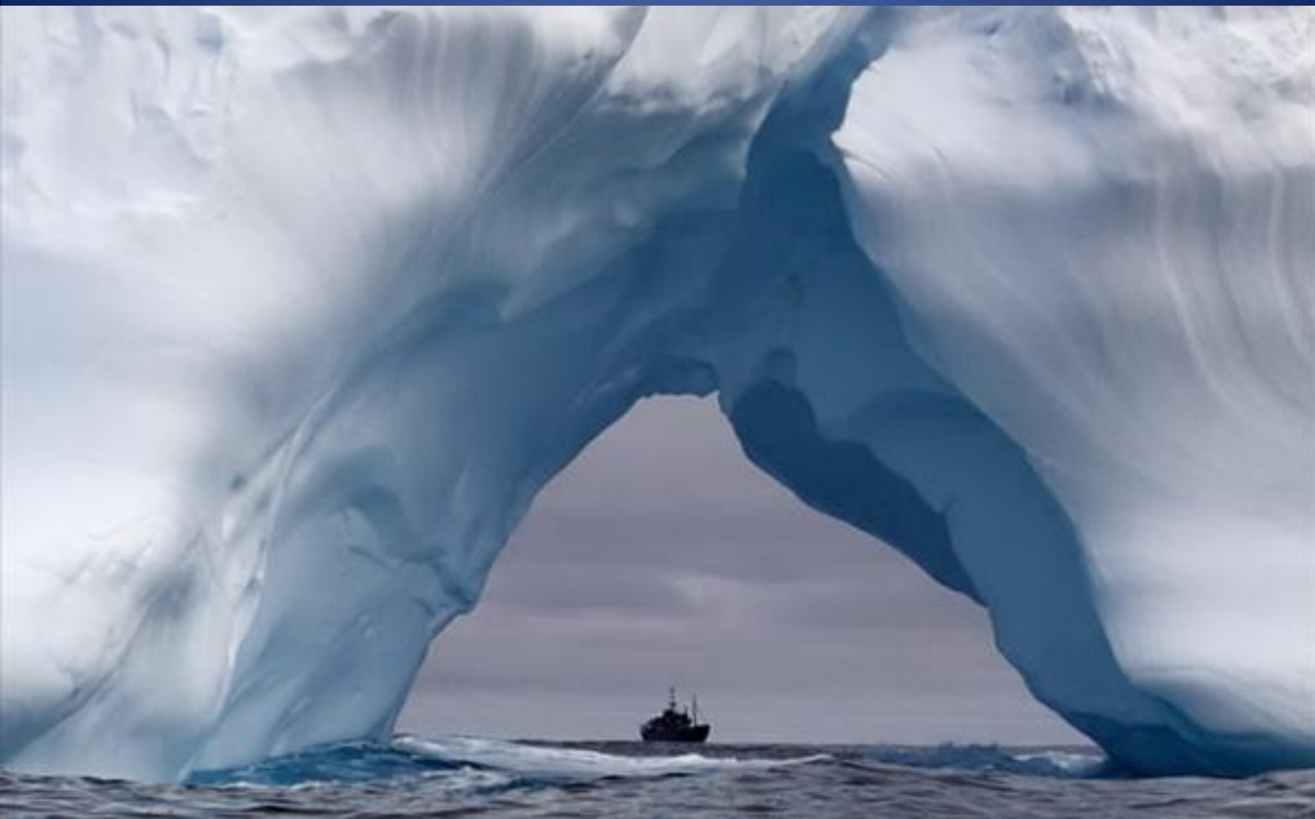
Айсберг Стива Ирвина