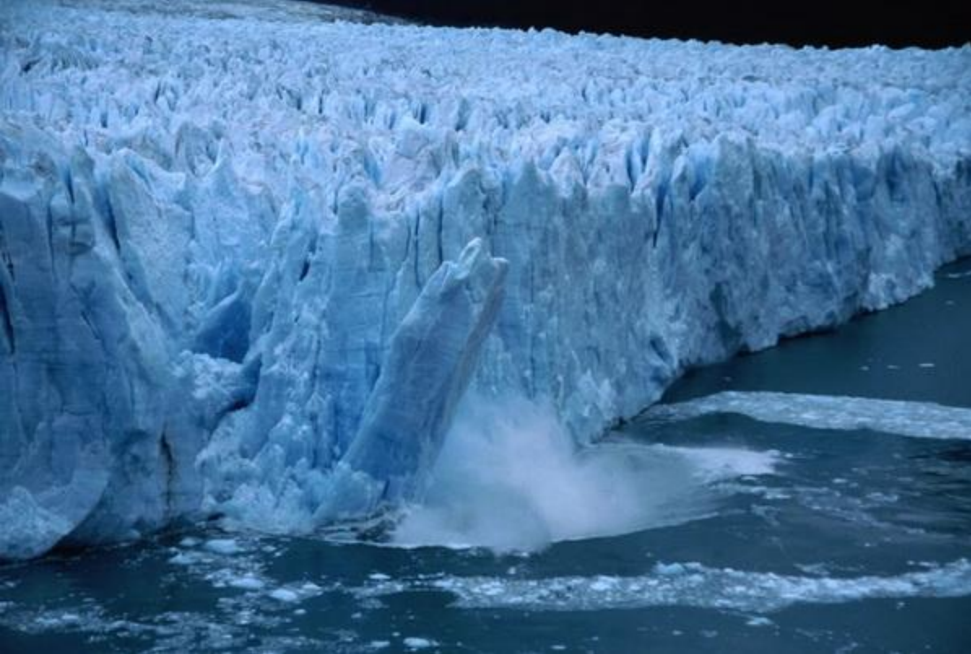
Айсберг откололся от ледника Перито-Морено