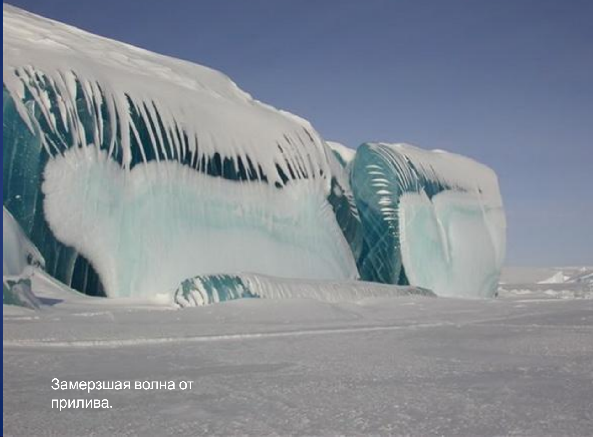
Замерзшая волна от прилива.