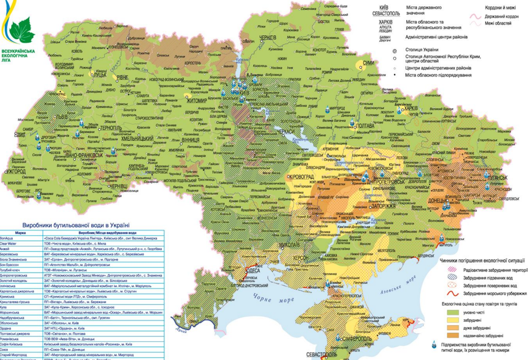
Виробники бутильованої води в Україні