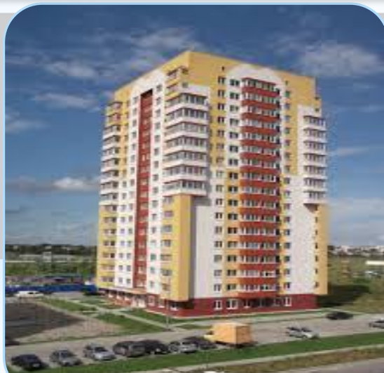
Многоквартирный жилой дом