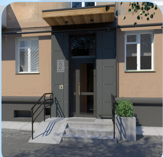
Подъезд жилого дома