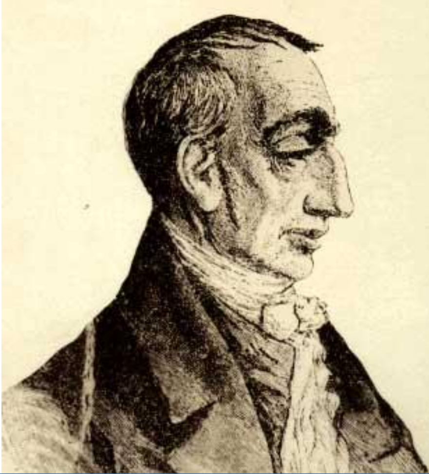
Клод Анри де Рувруа Сен-Симон