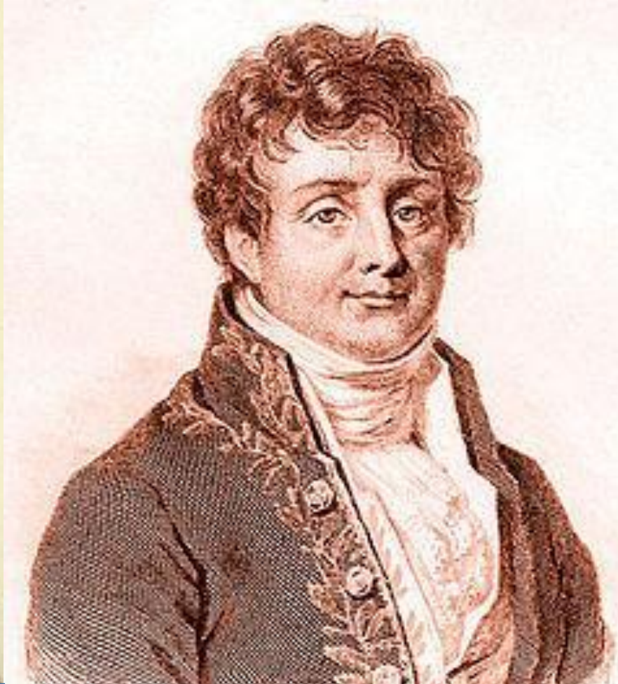
Жан Батист Жозеф Фурье