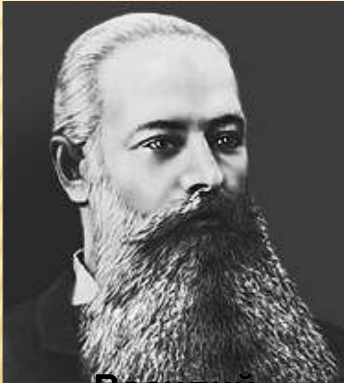
Василий Васильевич Докучаев