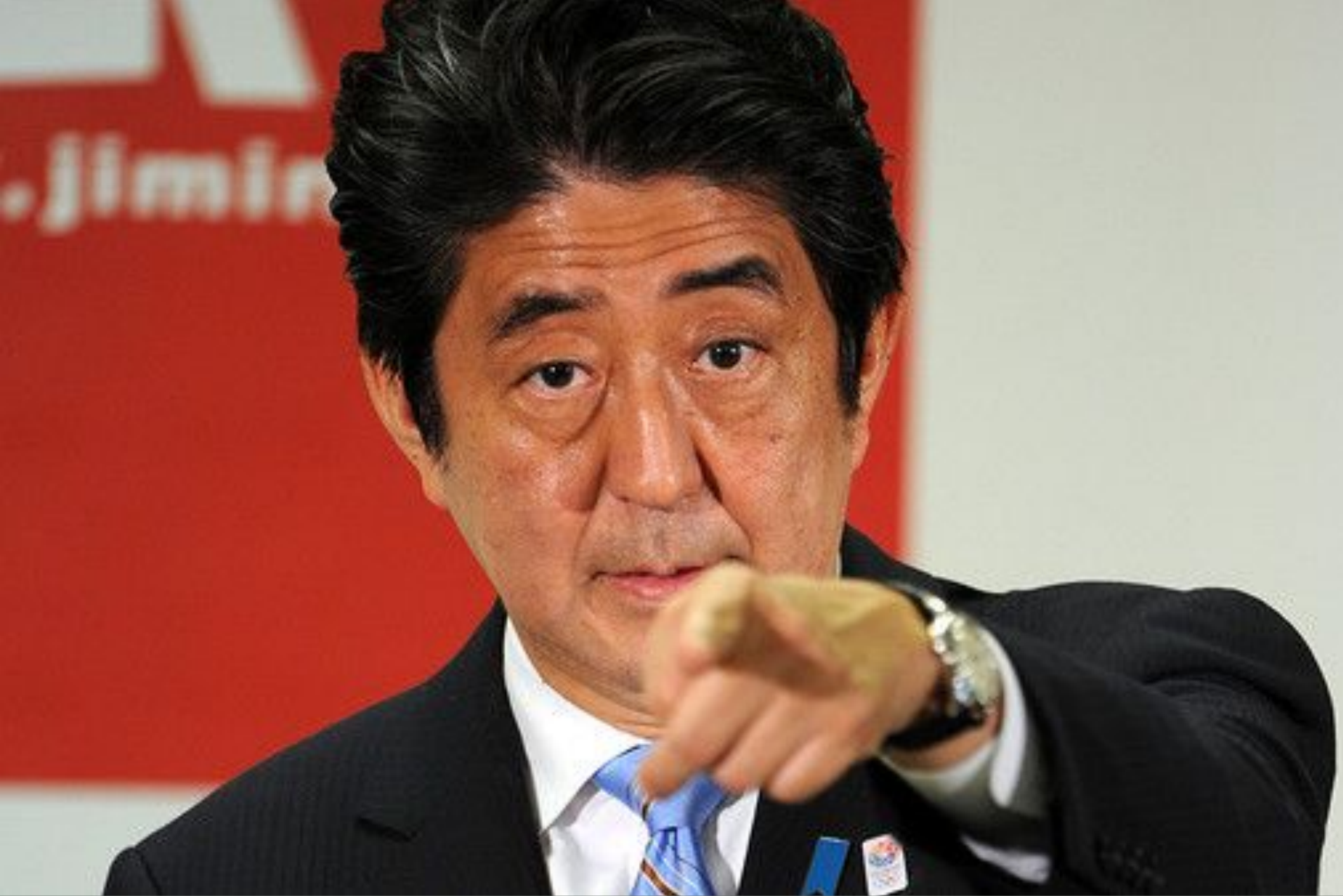
Синдзо Абэ – с июля 2012 занимает пост Премьер-министра страны как лидер ЛДПЯ (вторично)