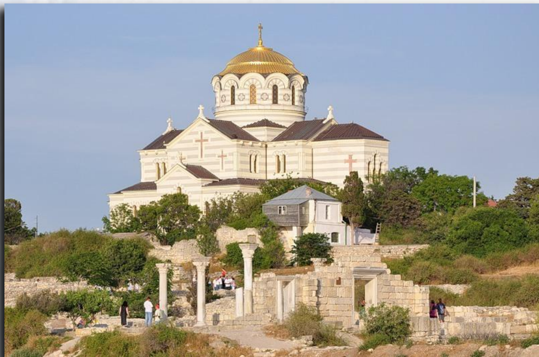
Владимирский собор в Херсонесе, Севастополь

Севастополь - город-герой, город морской славы - расположен на юго-западном побережье Крыма, на берегах Севастопольской бухты - одной из лучших природных гаваней в мире. Обилие удобных, хорошо защищенных скалистыми мысами бухт привлекало внимание людей еще в древности. Первые письменные упоминания о крымской земле и ее жителях относятся к V веку до н.э. Именно в это время, в 528 году до н. э., на берегу нынешней Карантинной бухты выходцами из Гераклеи Понтийской был основан Херсонес Таврический .