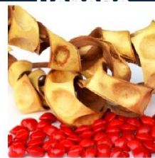
Индийское Сандаловое Дерево

Питает и увлажняет сухие волосы и кожу головы.