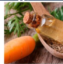
Корень и Масло

Богатая антиоксидантами морковь помогает предотвратить повреждение волос, восстанавливает их после недостатка питания и воздействия окружающей среды. Бета Каротин, Витамин А и Е питают волосы.