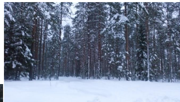
в лесу около озера Купальное