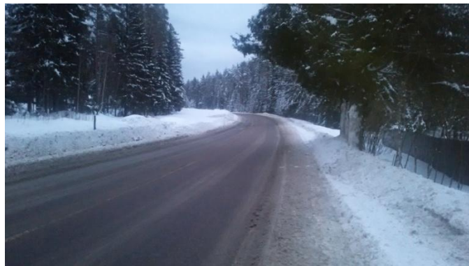
ФЕДЕРАЛЬНАЯ ДОРОГА А129