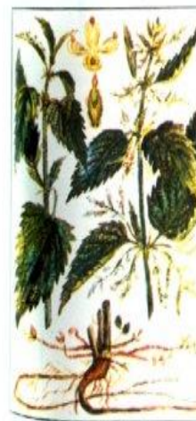
Рис. 60 Крапива двудомная