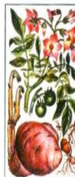
Рис. 53 Картофель сведебный

Лес является и богатым источником и поставщиком многочисленных лекарственных растений, на основе которых изготавливаются ценные лекарственные препараты. Все слышали о таких лечебных препаратах для укрепления сердечно-сосудистой системы, повышения и укрепления иммунитета организма как ландыш, пион, валериана, женьшень, элеутерококк и других.