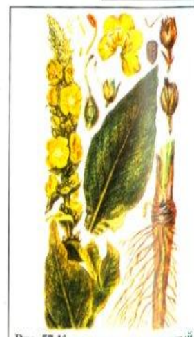
Рис. 57 Коровяк скипетровидный