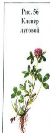
Рис. 56 Клевер луговой