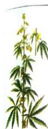
Рис. 58 Конопля посевная