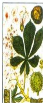
Рис. 54 Каштан конский