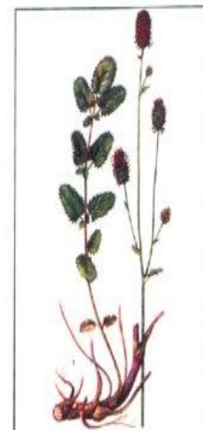
Рис. 61 Кровохлебка лекарственная