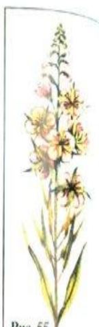
Рис. 55 Кипрей узколистный