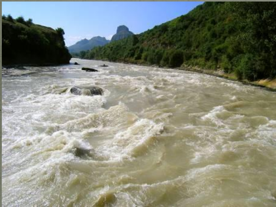
Кубань в верхнем течении