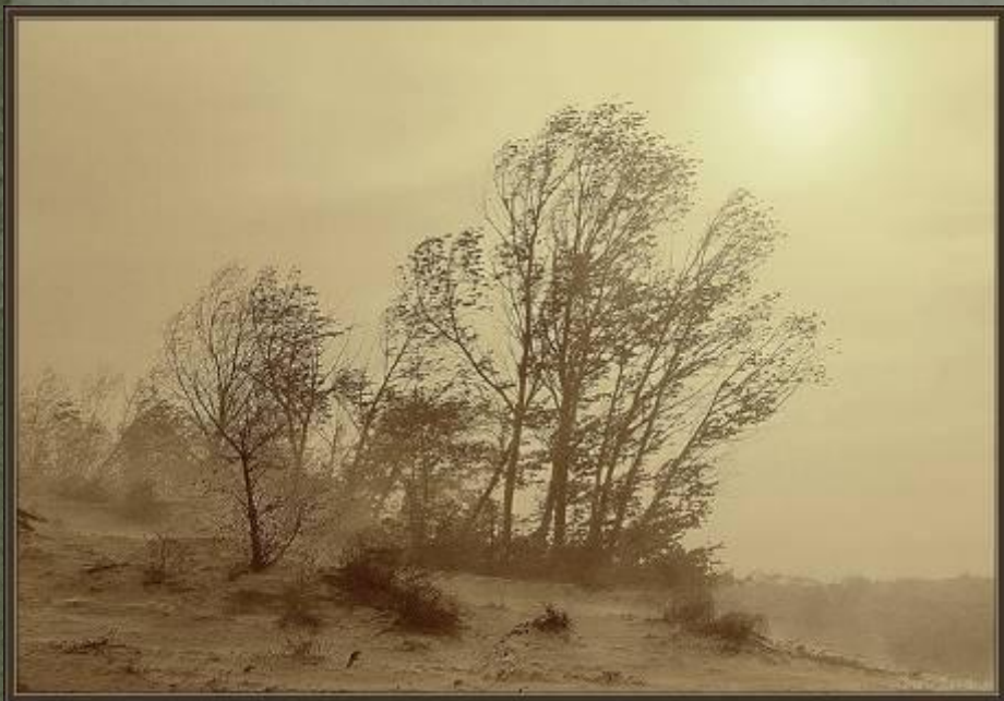
Пыльная буря в Прикаспии