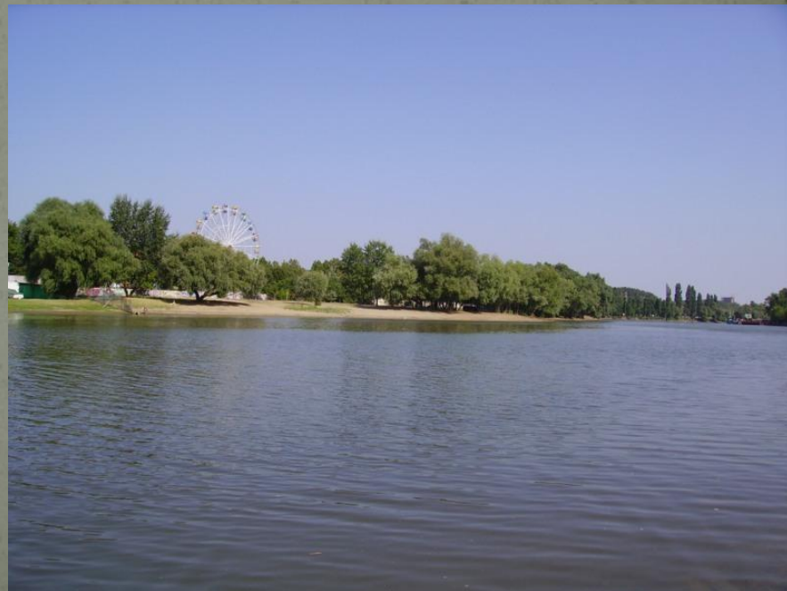
Кубань в нижнем течении