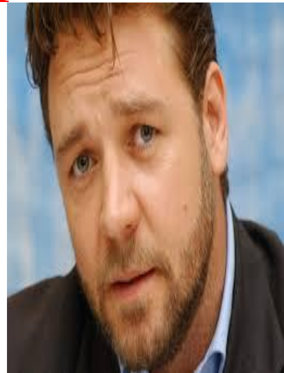
Рессел Креу 1964ж 17 сәуір. Актер.