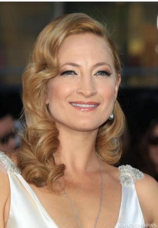
Белл Зои 1978ж 17 қараша. Актриса, каскадер.