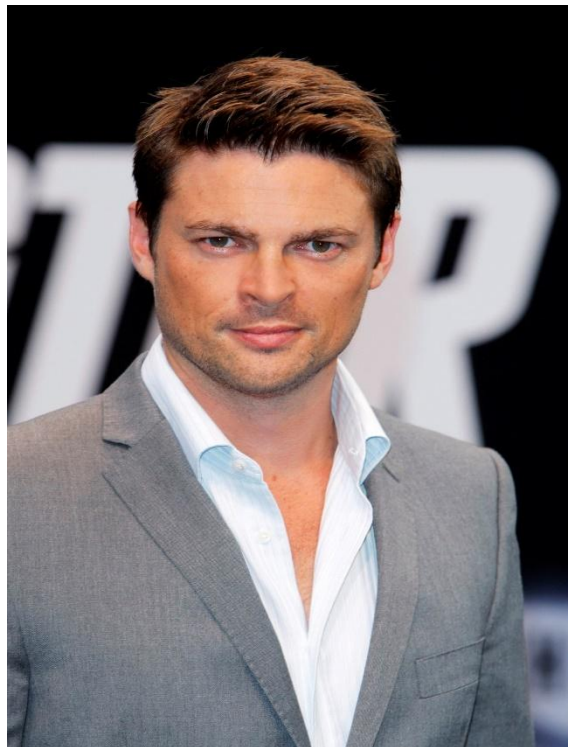
Карл Урбан 1972ж 7 шілде. Актер.