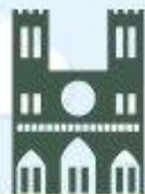
Собор Парижской Богородицы