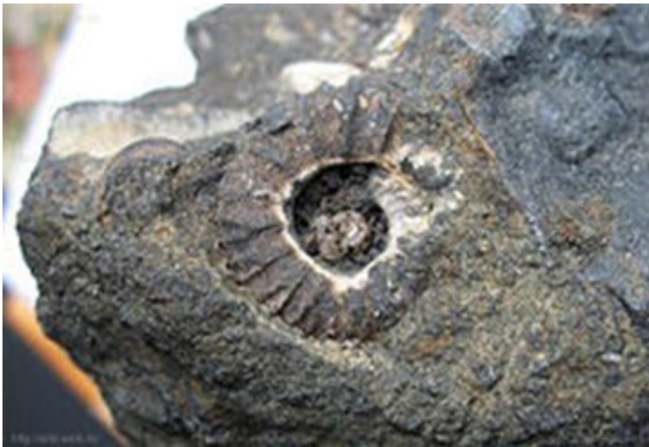
Аммонит в фосфоритовой конкреции. Нижний мел, р. Шмелёвка, Москва