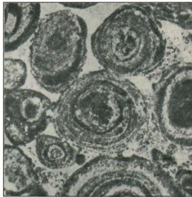
б) оолитовый фосфорит. Шлиф, 1 ник., увел. 22