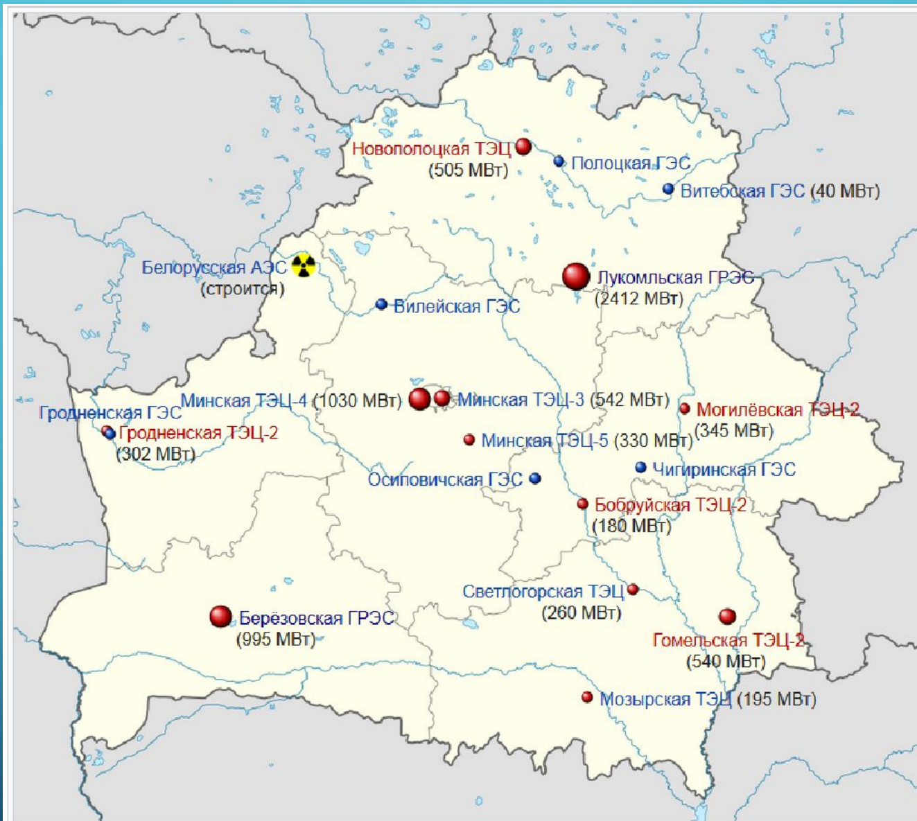
Крупнейшие атомные, тепло- и гидроэлектростанции Республики Беларусь и их установленная мощность