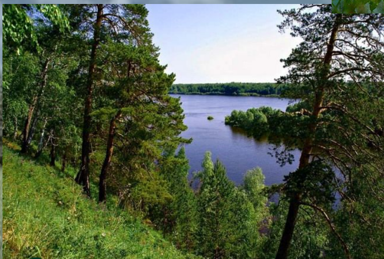
Создание заповедников, парков, скверов