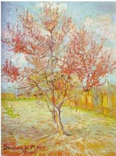
В. Ван Гог. Цветущее дерево