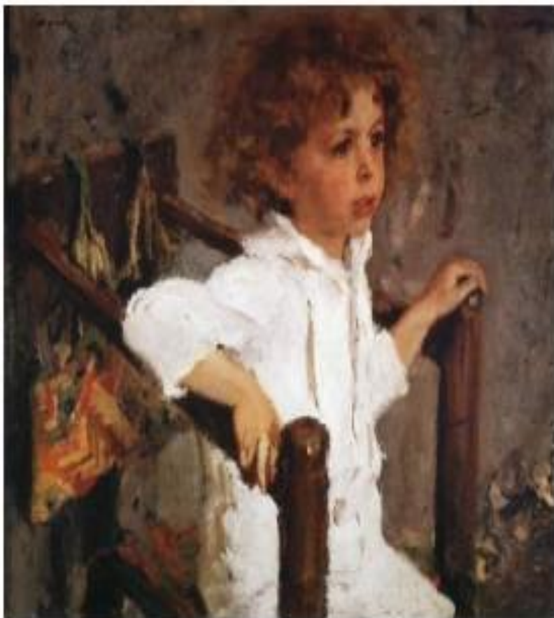
В. Серов. Портрет Мики Морозова

...что есть красота, И почему ее обожествляют люди? Сосуд она, в котором пустота, Или огонь, мерцающий в сосуде Н. Заболоцкий