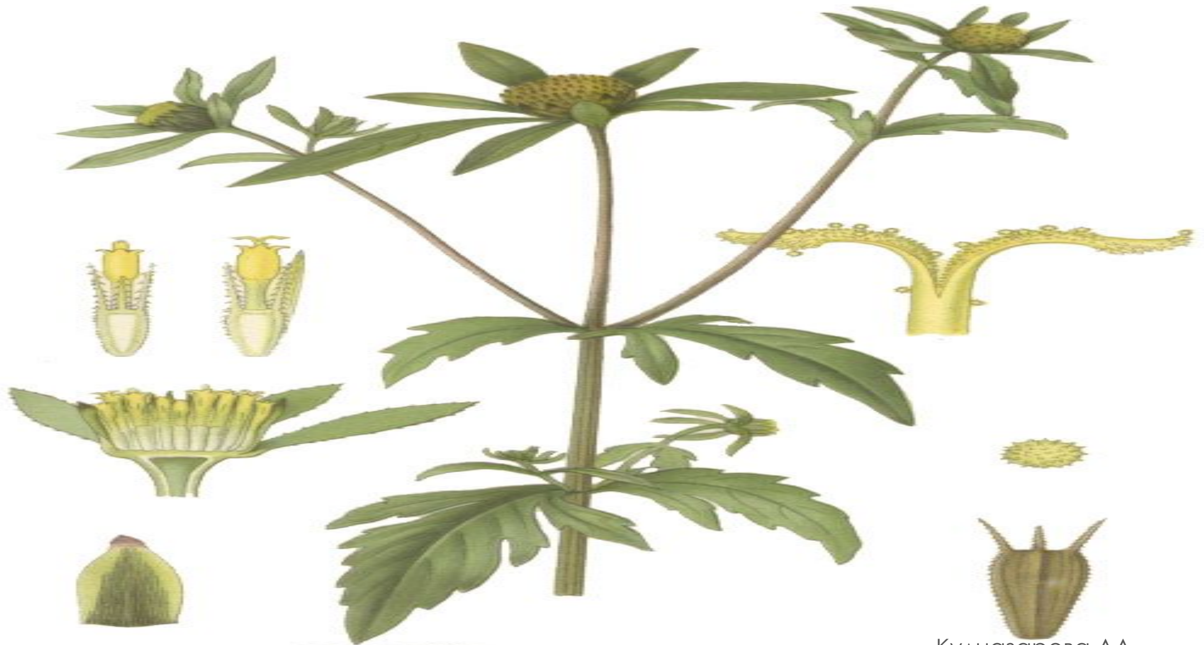
BRUNSKÄRA, BIDENS TRIPARTITA L.