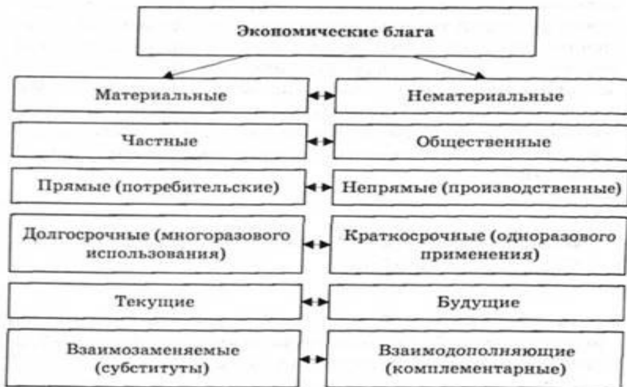
Рис. 5.14. Классификация экономических благ

Экономические блага — это блага трудовой деятельности человека, которые существуют в ограниченном количестве.