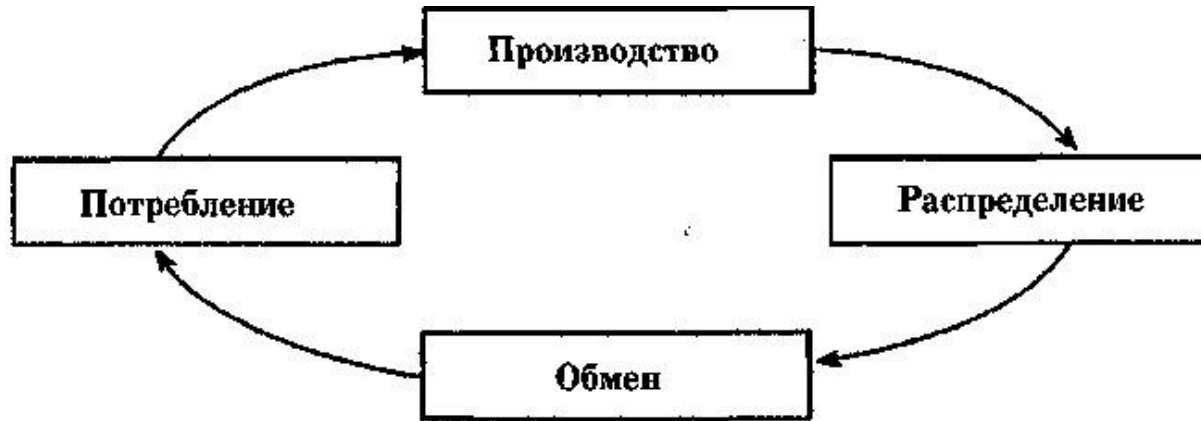
Рис. 1.2. Стадии движения продукта труда

Воспроизводство - это процесс постоянного повторения производства