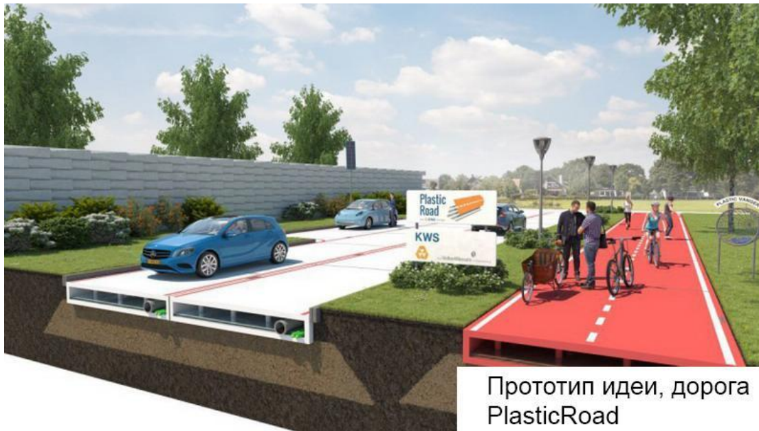
Прототип идеи, дорога PlasticRoad

Дорожные плиты должны не уступать по прочности асфальту, при этом быть дешевле в виду используемого материала. Для усиления и удешевления конструкции в смесь будет добавлен материал с пенообразованием \approx 1,5 .