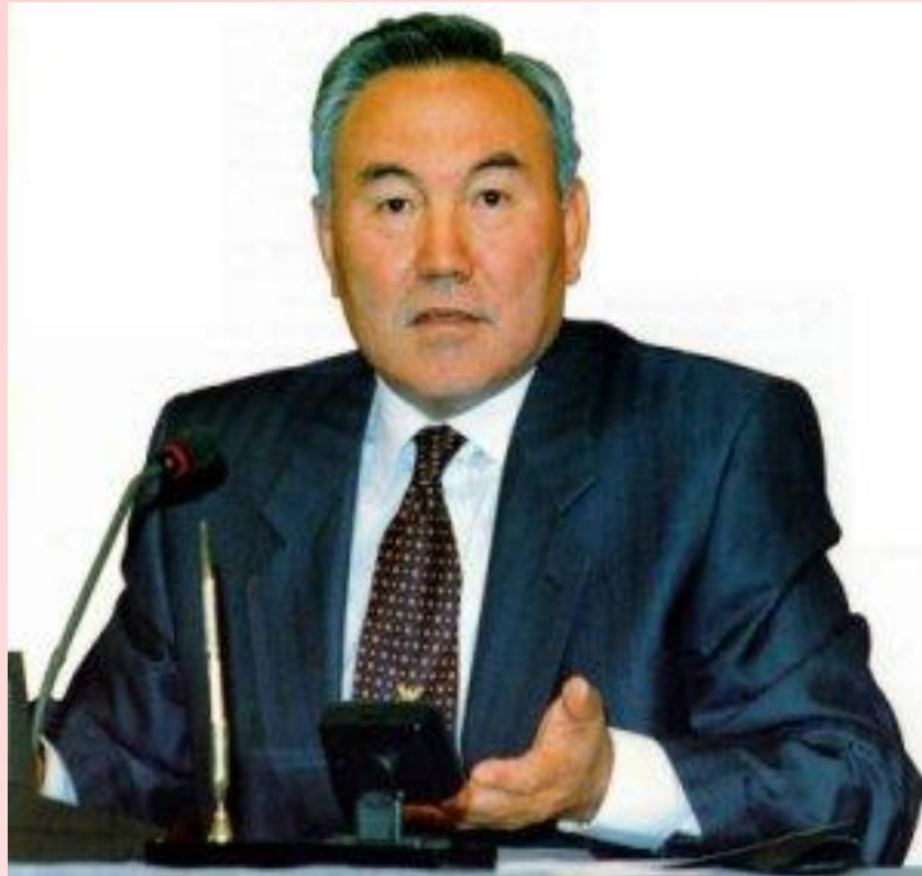
Нурсултан Абишевич Назарбаев