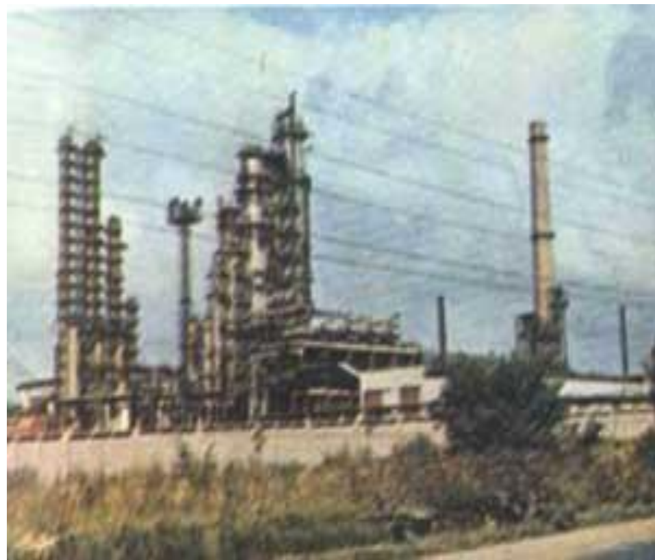
Установки вторичной перегонки бензина и атмосферной перегонки на НПЗ "Славнефть-ЯНОС" (слева направо).

При вторичной перегонке от бензиновой фракции отгоняются сжиженные газы, и осуществляется её разгонка на 2-5 узких фракций на соответствующем количестве колонн.