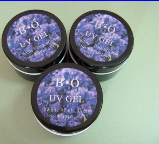
Гель для наращивания ногтей