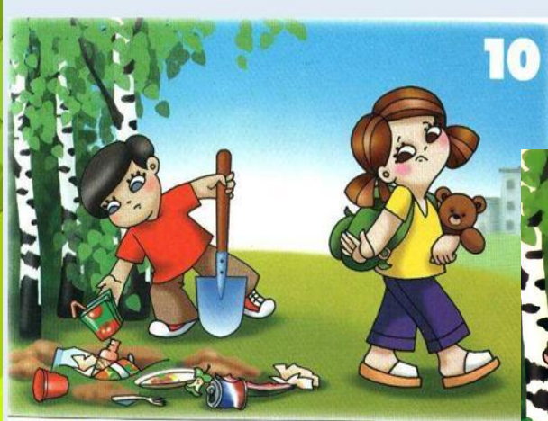
Не оставляй мусор в лесу