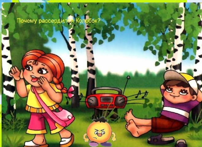
Не шумите в лесу! Громкая музыка, крик пугают зверей и птиц, они покинут свои норы и гнезда.