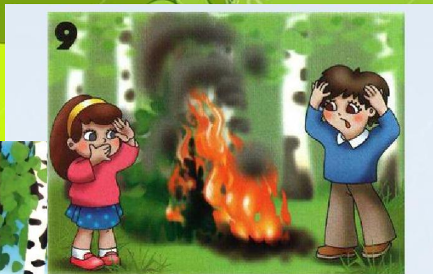
разжигай костёр в лесу без взрослых