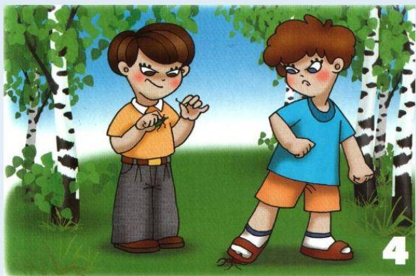
Не обижай насекомых