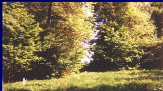
Вековые туи дальневосточные