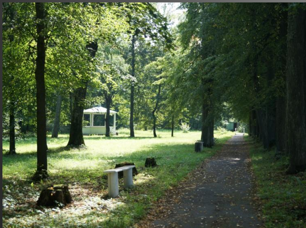
Беседка в Рогожском парке

По преданиям, сам А.Н.Карамзин высаживал молодые дубки в будущих аллеях, которым теперь около 200 лет. В парке представлены все основные древесные породы зоны, а также есть и привезенные. Это 5 сибирских пихт и кедр (сосна сибирская)