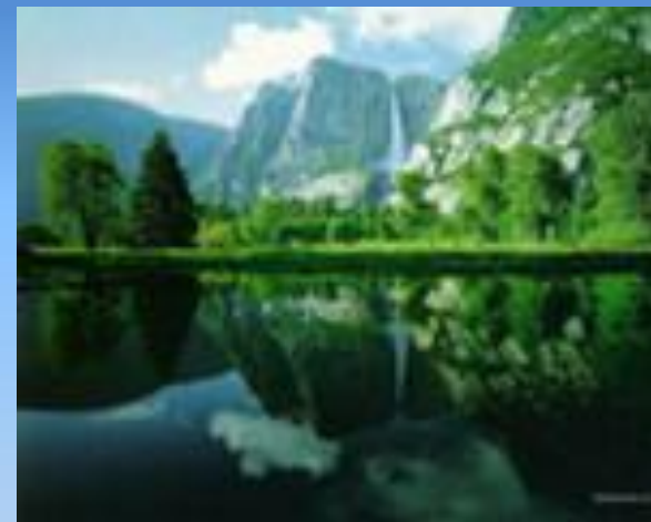
Реки, озера, болота 0,03 %