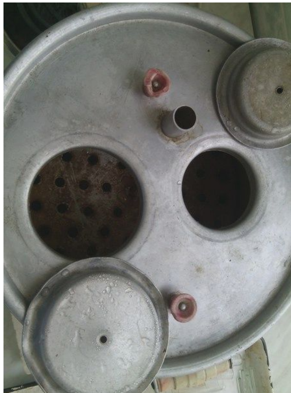
Аппарат инфундирный АИ-3.