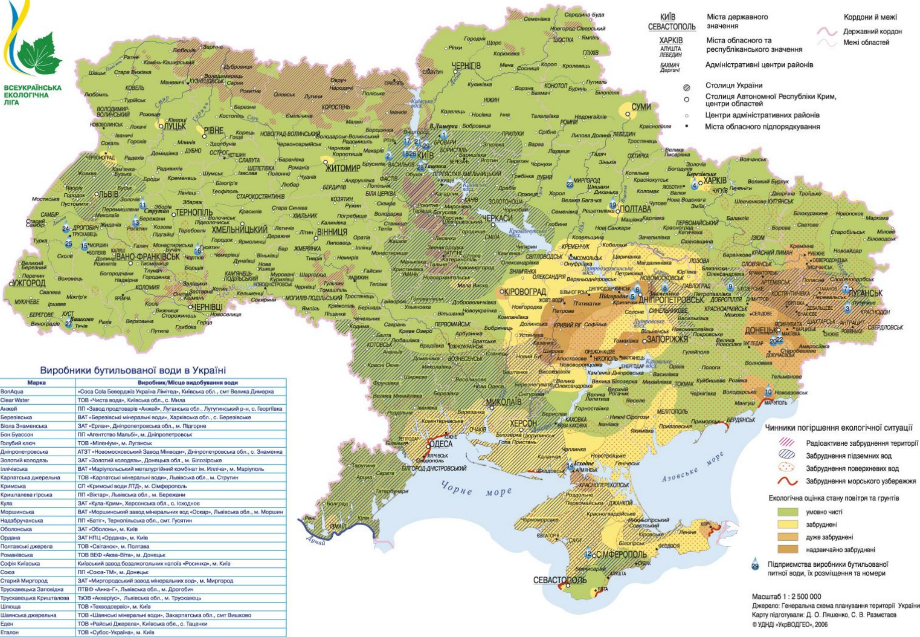
Виробники бутильованої води в Україні