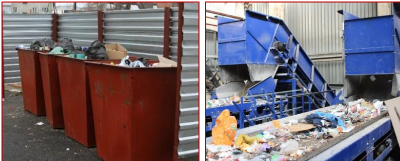
Традиционная система утилизации