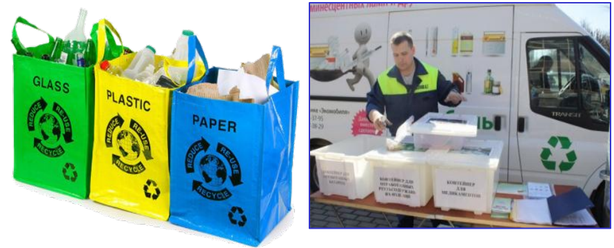
Альтернативная система утилизации