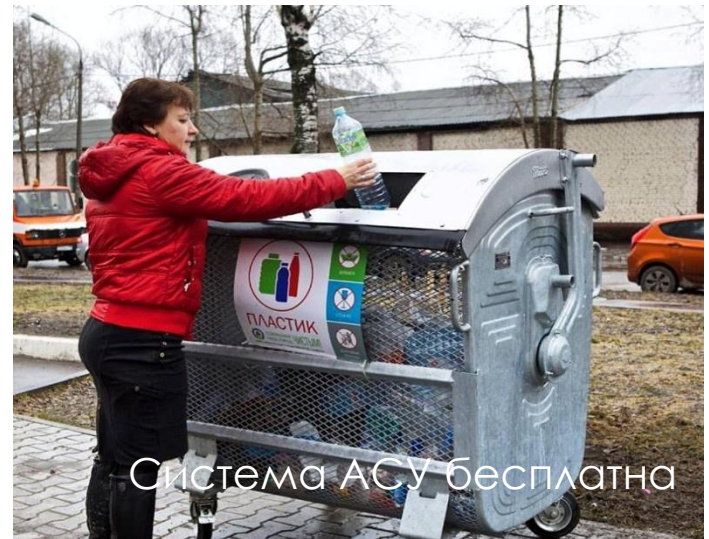
Система АСУ бесплатно