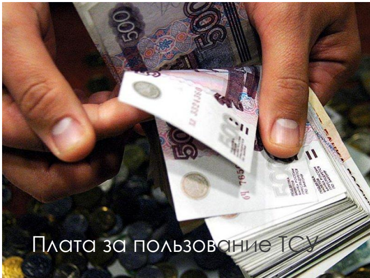
Плата за пользование ТСУ