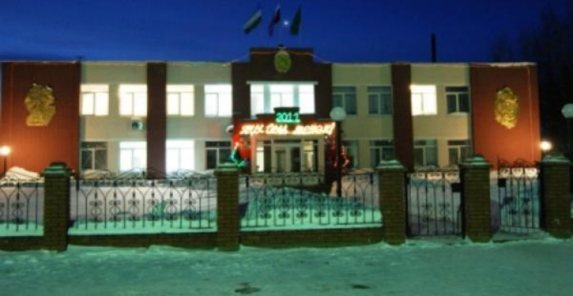
Администрация муниципального района