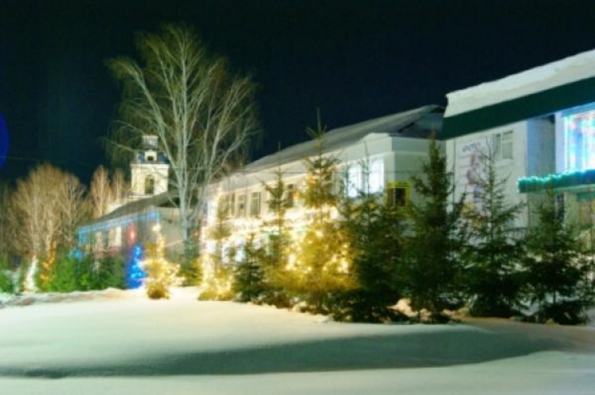
Вечер в Аскино