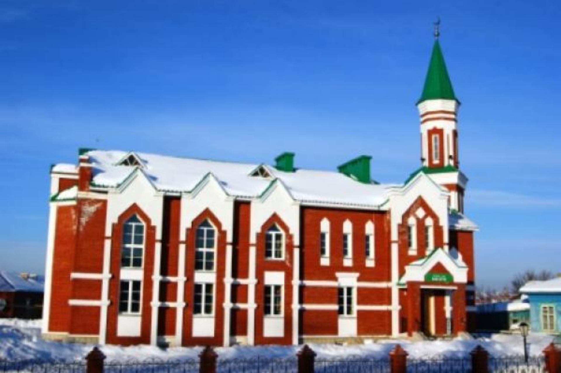
Аскинская центральная мечеть