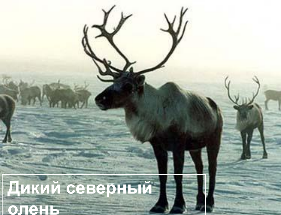
Дикий северный олень