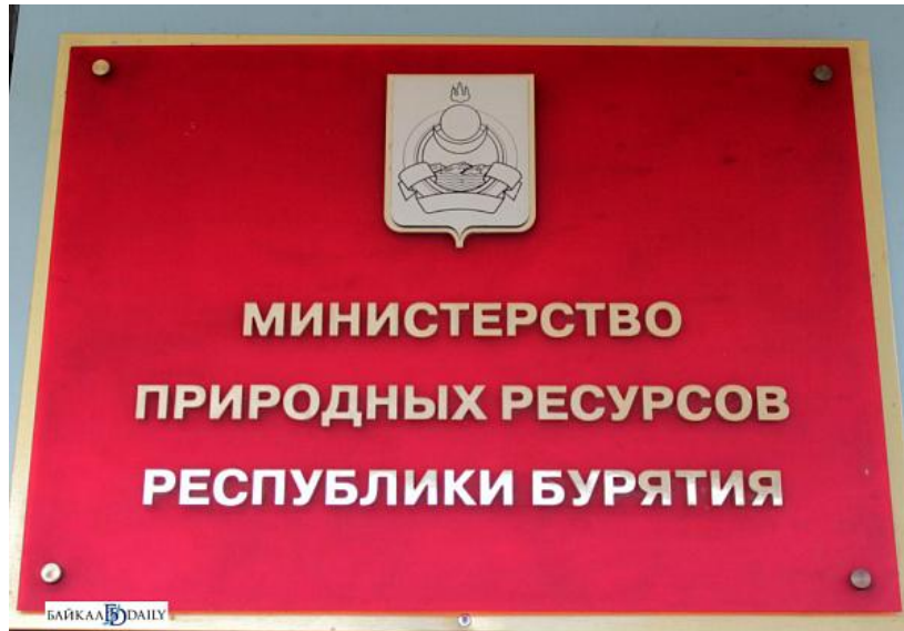
Министр природных ресурсов Республики Бурятия Сафьянов Юрий Павлович