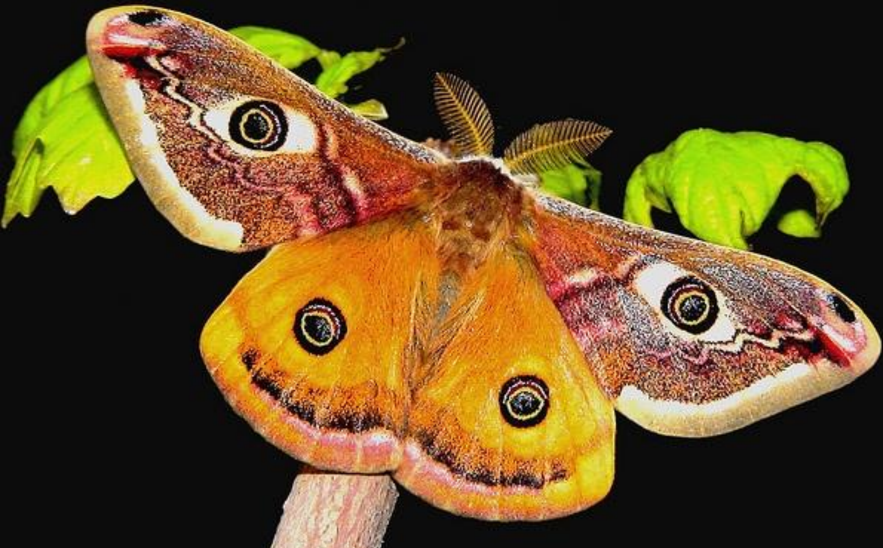
МАЛЫЙ НОЧНОЙ ПАВЛИНИЙ ГЛАЗ