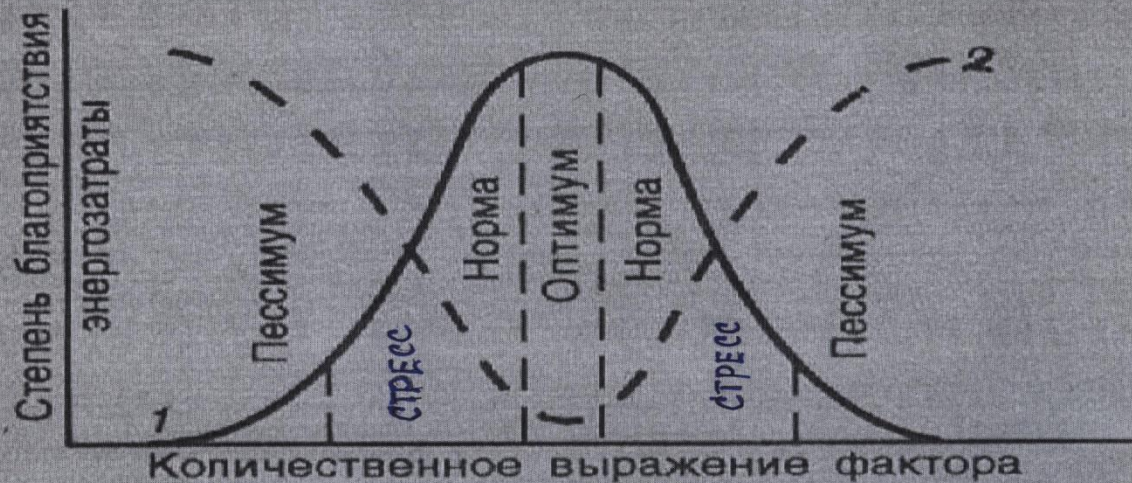
Рис. 8.1. Влияние изменения количественного выражения фактора среды на жизнедеятельность организма (по И.А. Шилову, 1985)

1 — степень благоприятствования данных доз для организма, 2 — величина энергозатрат на адаптацию. Схема условная; предполагается, что все остальные факторы действуют в оптimumе