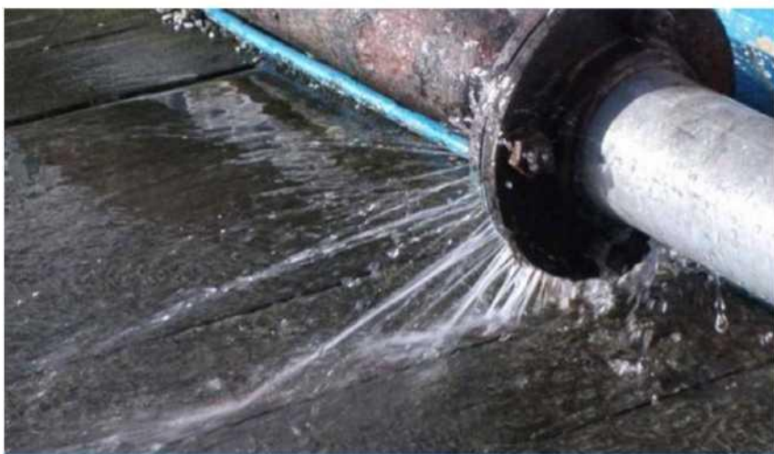
Аварии на инженерных коммуникациях