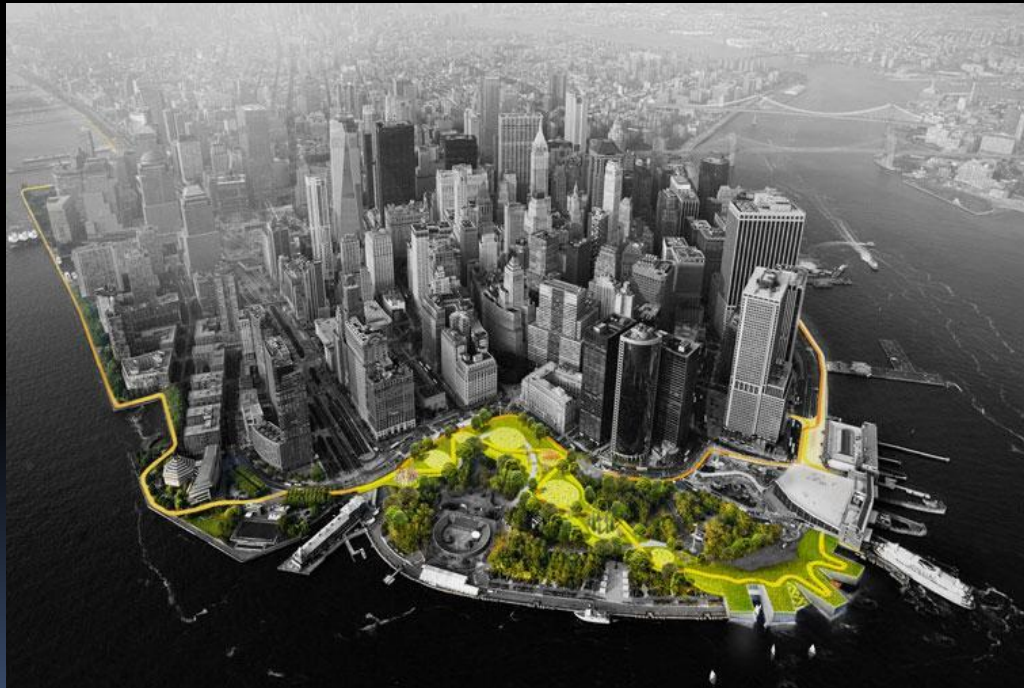
Проект BIG U (Нью-Йорк)

Снижение уязвимости города перед природными катастрофами (наводнения, ураганы и другие)