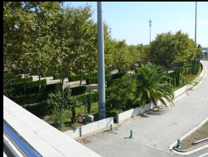
Парк Nus de la Trinitat, Испания