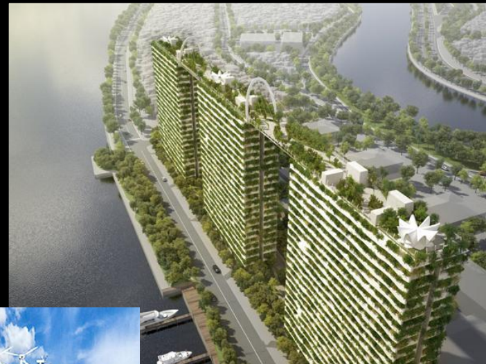
Комплекс Diamond Lotus, Вьетнам, Хошимин