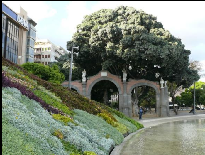
Площадь в Санта-Крус, Испания