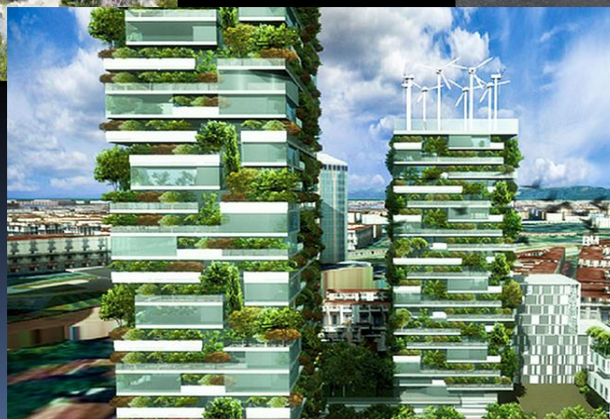
Bosco Verticale («Вертикальный лес»), Италия