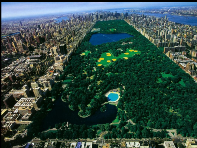
Центральный парк в Нью-Йорке