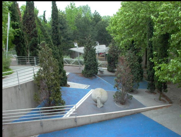
Парк Ла Вилет (Париж)