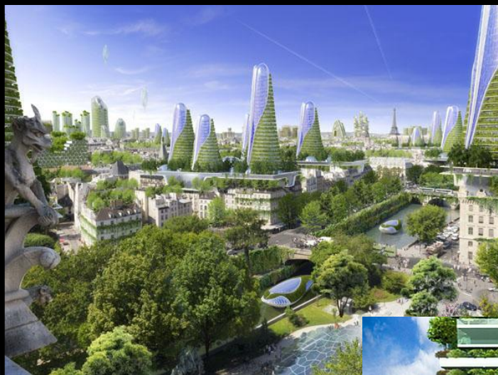
Paris Smart 2050