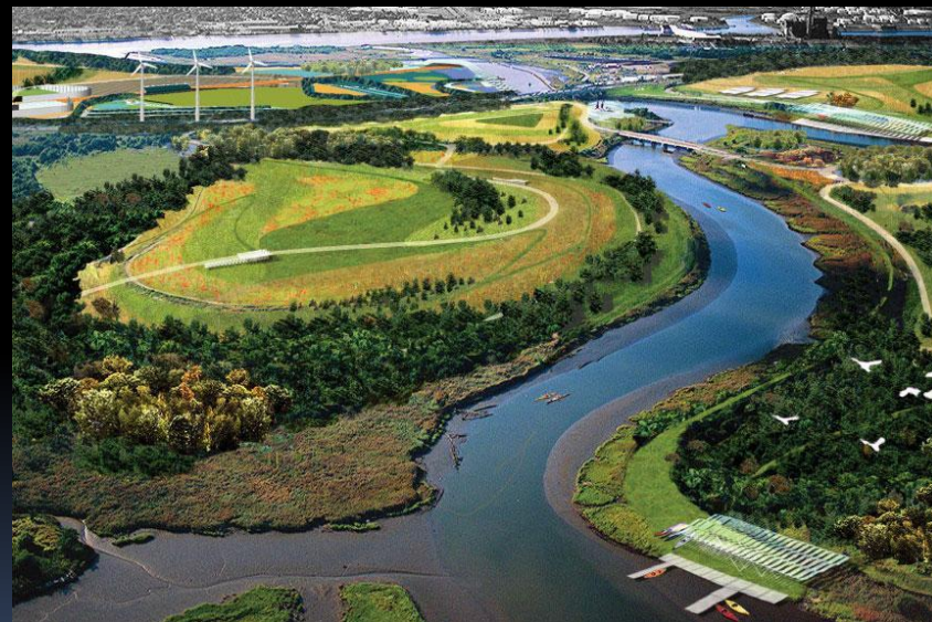
Проект Field Operations