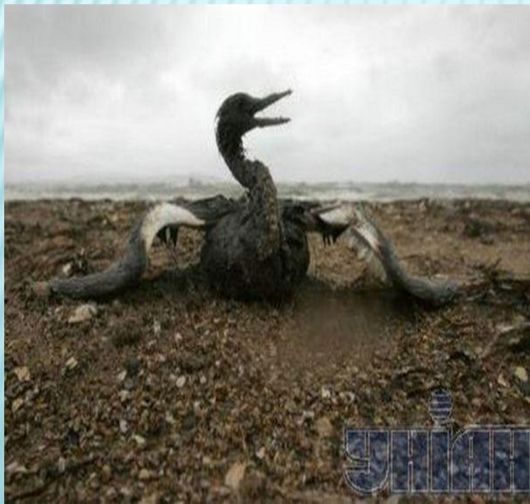
Разлив нефти, Керченский пролив