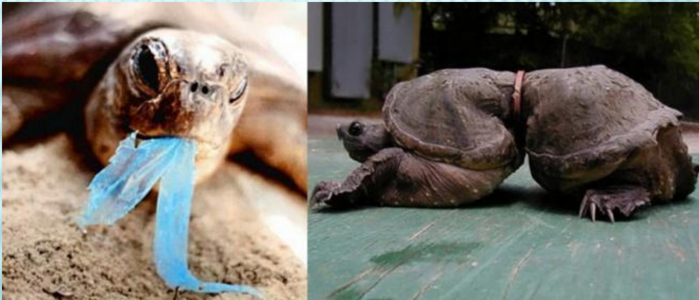
Черепашка, в детстве угодившая в пластиковое кольцо и выросшая в нем.