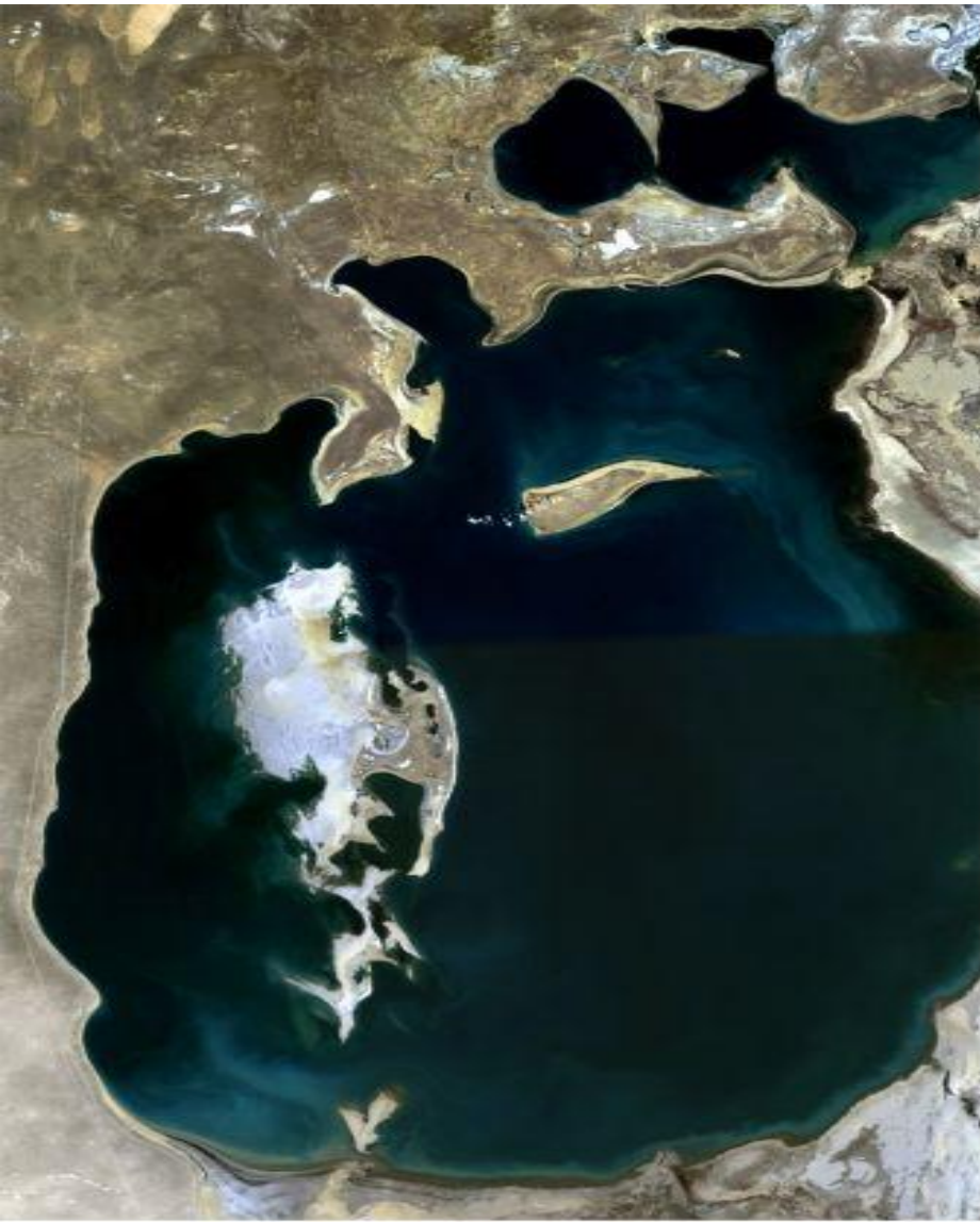
July - September, 1989