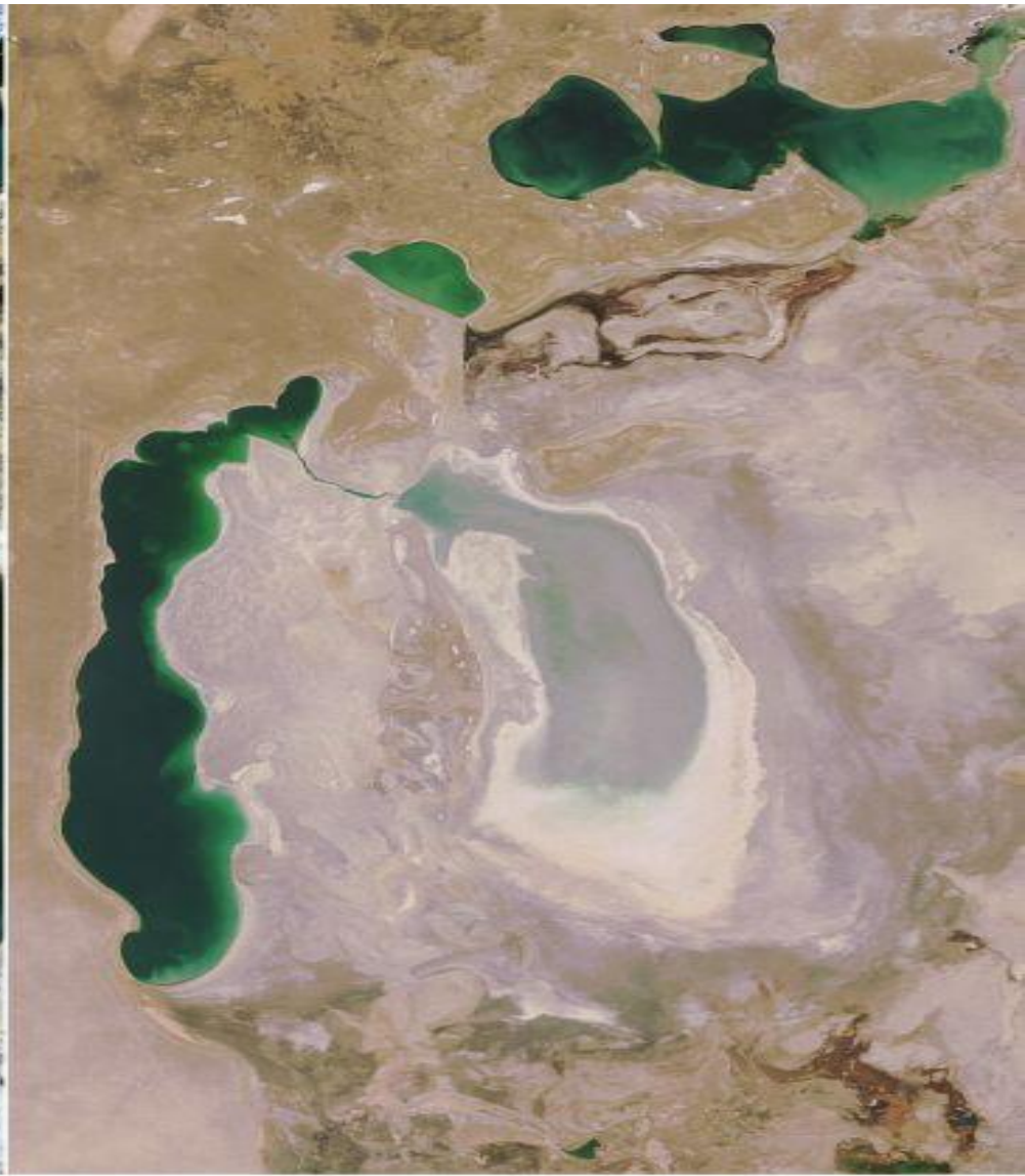
October 5, 2008