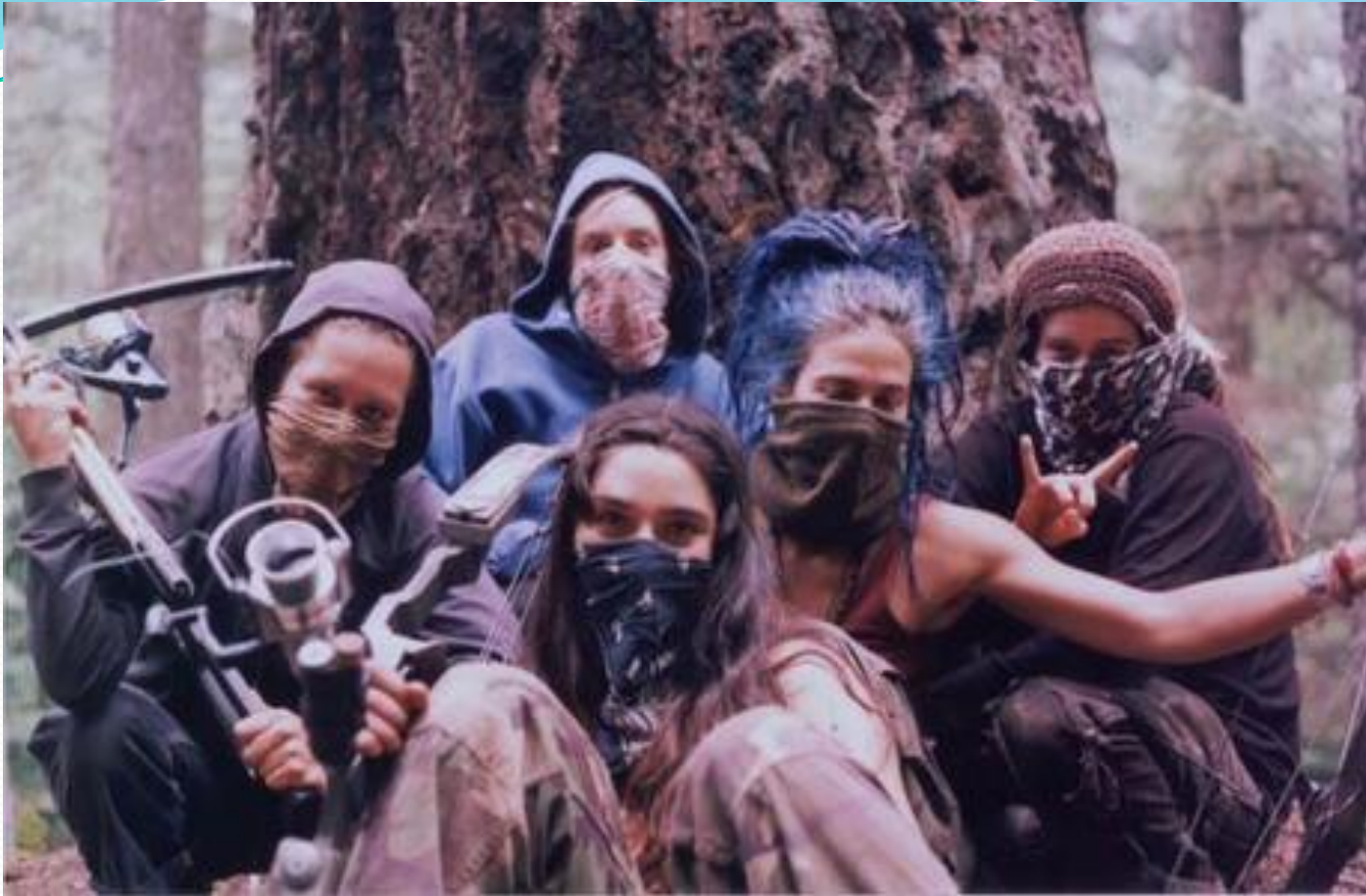
The Womyn's action group poses for a photo at the 2004 Straw Devil Action Camp in the Willamette National Forest. This camp is seen as the origin of TWAC