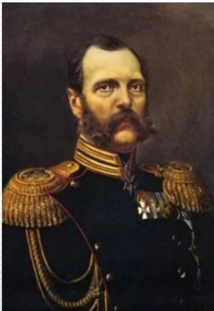
Александр II (Александр Николаевич Романов) (1818 - 1881)

«Конституция» М. Т. Лорис-Меликова (1881)