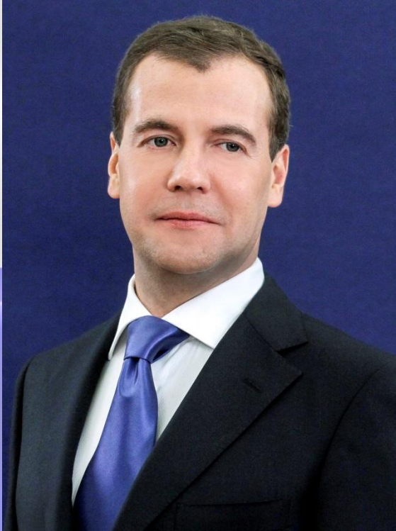
Дмитрий Анатольевич Медведев – Председатель Правительства РФ