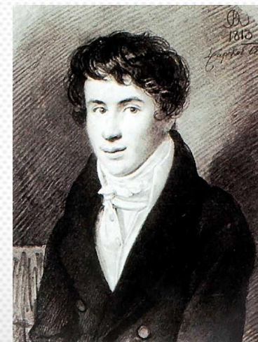
Н. М. Муравьев (1795 - 1843)