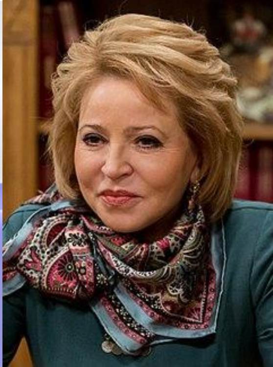
Валентина Ивановна Матвиенко – Председатель Совета Федерации Федерального Собрания РФ

Сайт Совета Федерации - http://council.gov.ru/