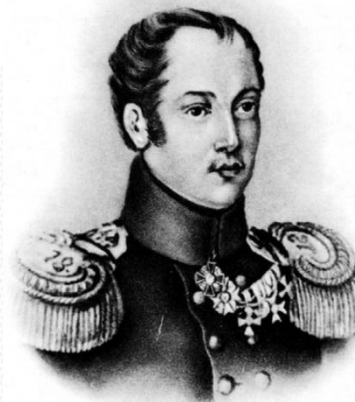
П. И. Пестель (1793 - 1826)