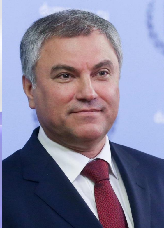
Вячеслав Викторович Володин – Председатель Государственной Думы

Федерального Собрания РФ Сайт Государственной Думы –