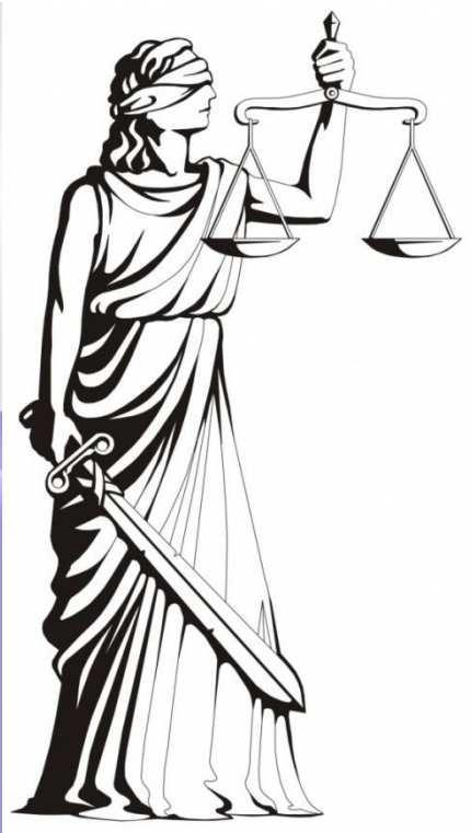
Фемида – богиня правосудия и порядка