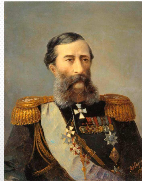
М. Т. Лорис-Меликов (1824-1888)