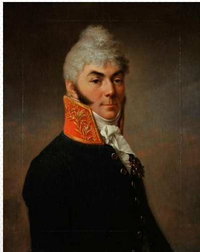
Н. Н. Новосильцев (1761 - 1838)