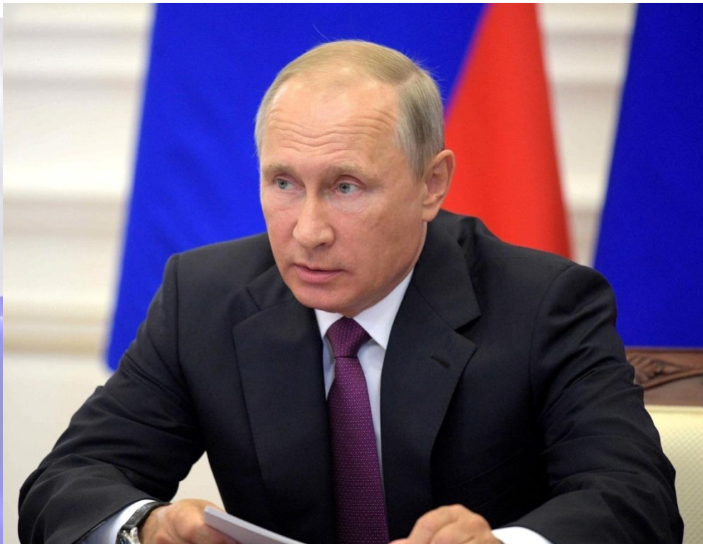
Владимир Владимирович Путин – ныне действующий Президент РФ

Сайт Президента - http://www.kremlin.ru/