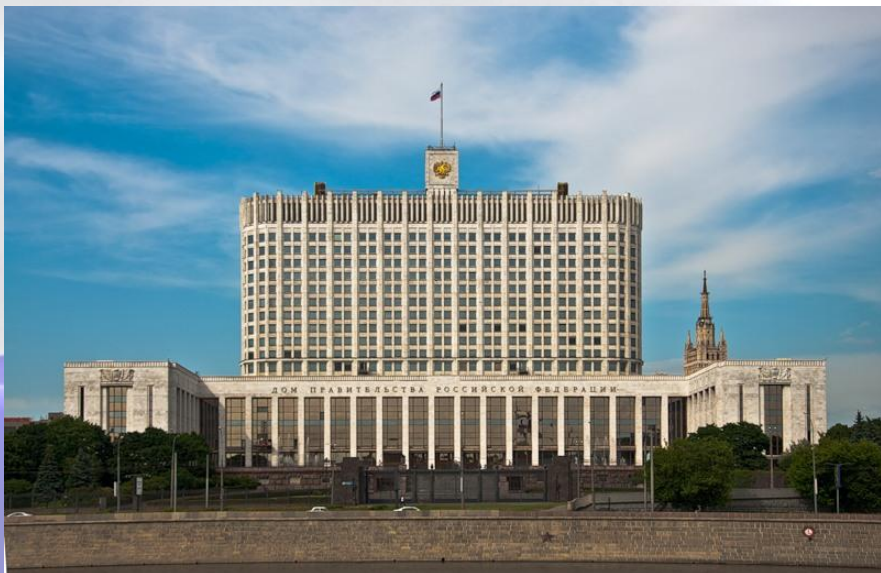
Дом Правительства РФ

Сайт Правительства РФ – http://government.ru/