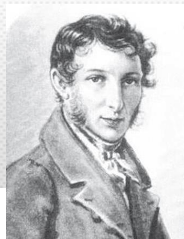
С. П. Трубецкой (1790-1860)