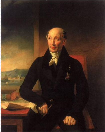
М. М. Сперанский (1772 - 1839)