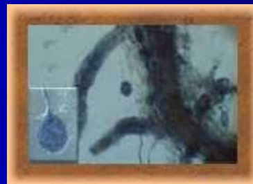
Грибки коренів рослин