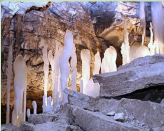
Кунгурская ледяная пещера