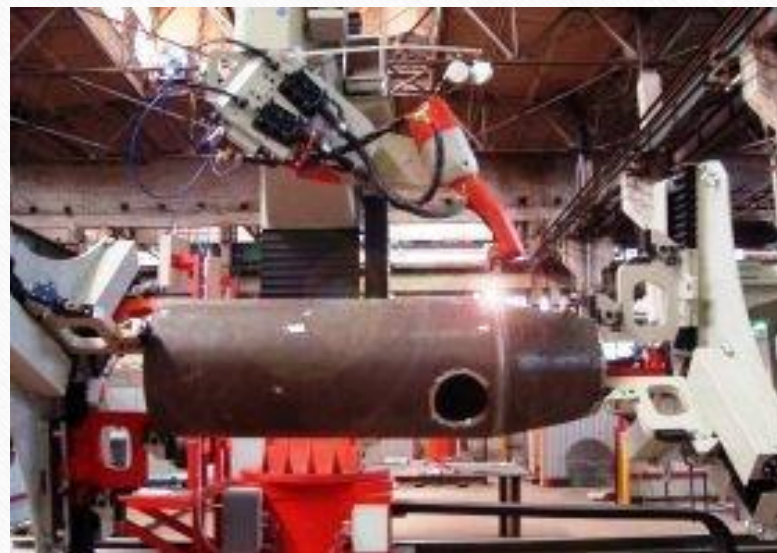
Сварка грязевика Ду600 на робототехническом сварочном комплексе IGM