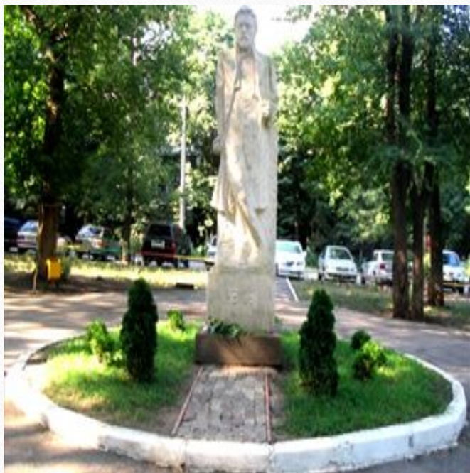
Сквер им. Чехова

Сквер имени Антона Чехова – от свежего воздуха здесь только воспоминания.