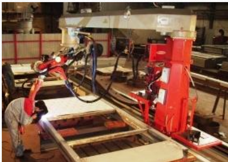
Сварка щита нержавеющей купольной крыши для резервуара 10000 куб.м.