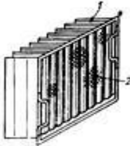
Рис. III.31. Фильтр рамочный бумажный 1 — фильтрующая бумага; 2 — сетка